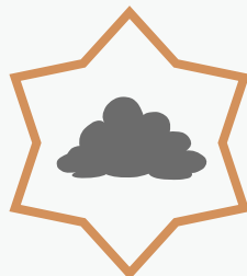
un nuage gris