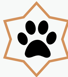
une trace animale