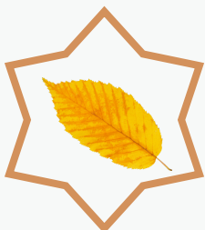
une feuille morte