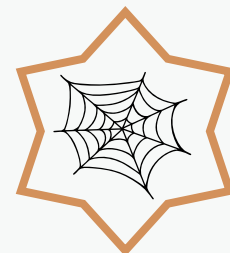
une toile d'araignée